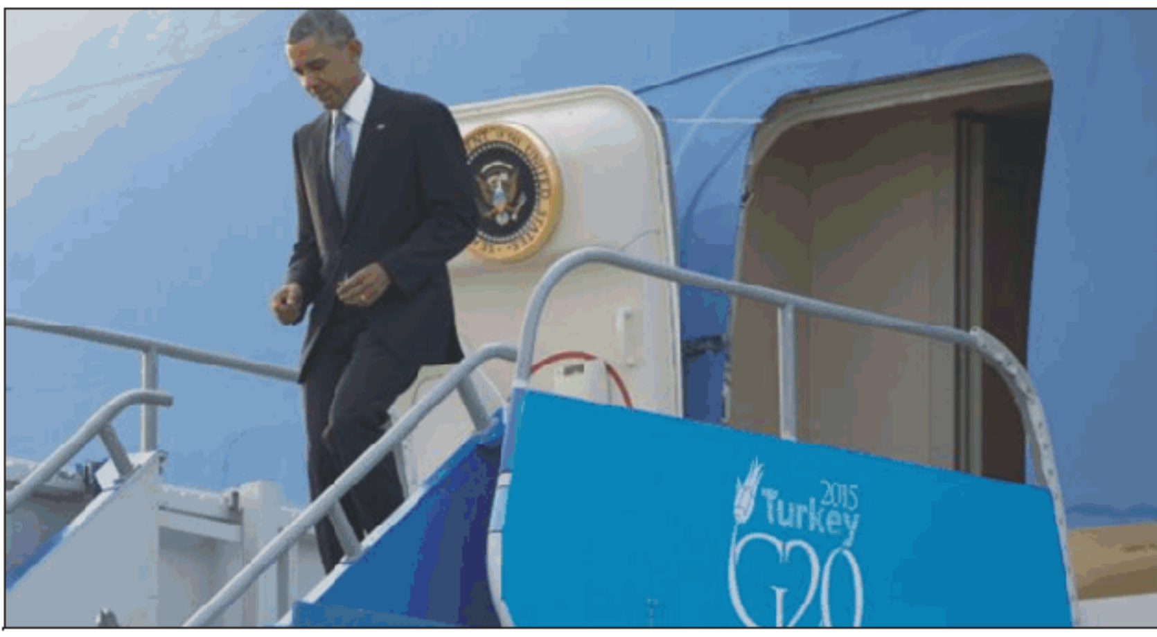
جريدة يومية مابلاستنة