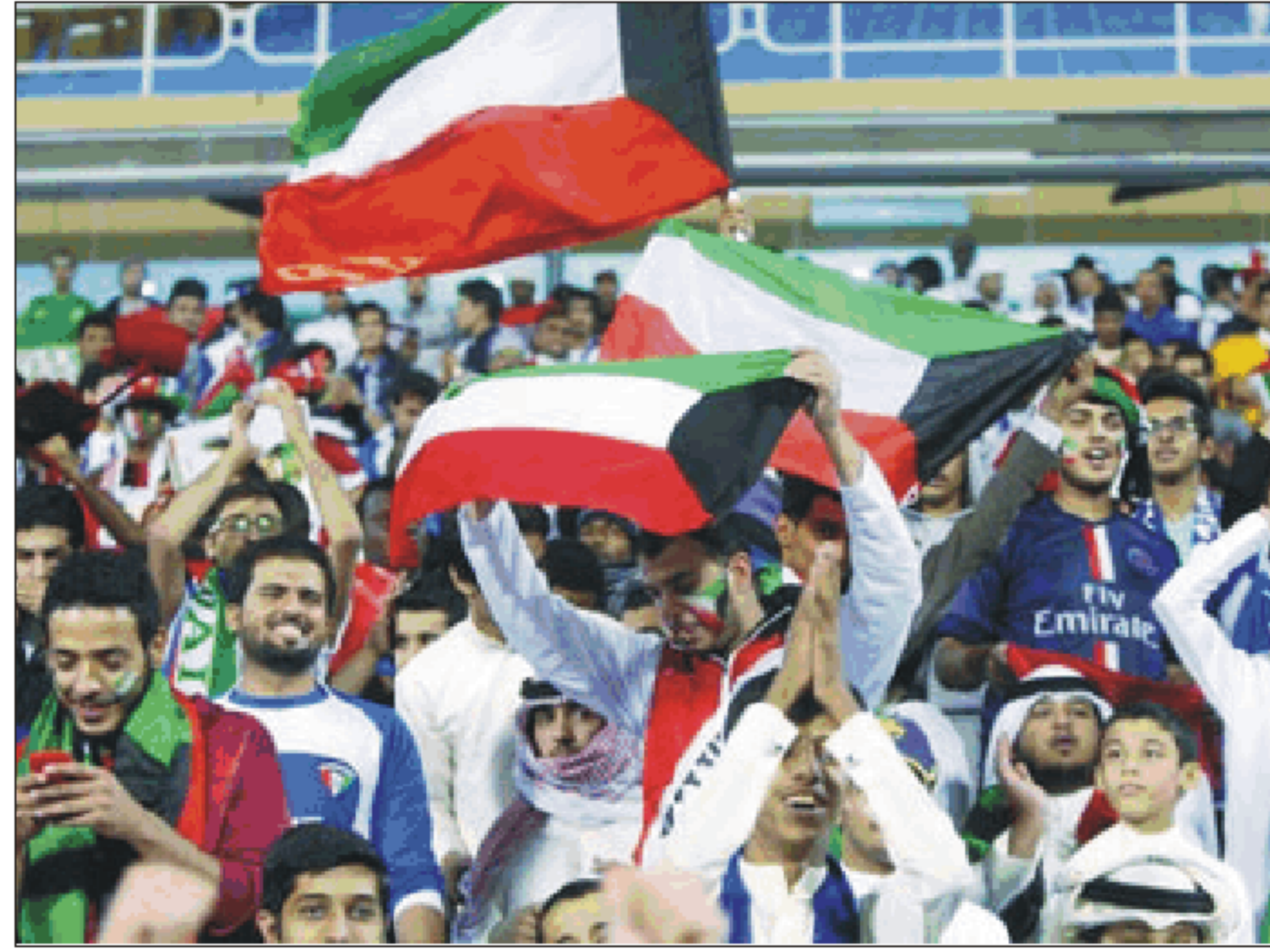
القياسي في عدد مرات إحراز اللقب برصيد عشر مرات. وأحرزت قطر لقب خليجي ٢٢ في الرياض في مرات أخرها في ٢٠٠٣ لكنها تحمل الرقم

العام الماضي بعد فوزها في المباراة النهائية على السعودية صاحبة الأرض. وتلقت الكرة الكويتية ضربة جديدة الجمعة الماضي عندما أعلن الاتحاد الدولي لكرة القدم إيقاف الاتحاد الكويتي بعد انتهاء المهمة التي منحتها للحكومة لتغيير قانون رياضي. وأضاف الفيفا "إن يحق لأي فريق من الكويت من أي نوع (بما في ذلك الأندية) القيام بأي نشاط رياضي دولي وإن يحق للاتحاد الكويتي لكرة القدم أو لأي من أعضائه أو مسؤوليه الاستفادة من أي برامج تطوير أو دورات أو تدريبات تابعة للفيفا أو الاتحاد الآسيوي لكرة القدم". وبعد استبعاد فريق الكويت والقاسية من خوض قبل نهائي كأس الاتحاد الآسيوي باتت منتخب الكويت مهددا بالاستبعاد أيضا من التصفيات المشتركة لكأس العالم ٢٠١٨ وكأس آسيا ٢٠١٩. ومن المفترض أن تلعب الكويت مع ميانمار في ١٧ نوفمبر/تشرين الثاني المقبل. وسبق أن عوقبت الكويت بالإيقاف بسبب التدخل الحكومي في شؤون اللعبة مرتين في ٢٠٠٧ و ٢٠٠٨.