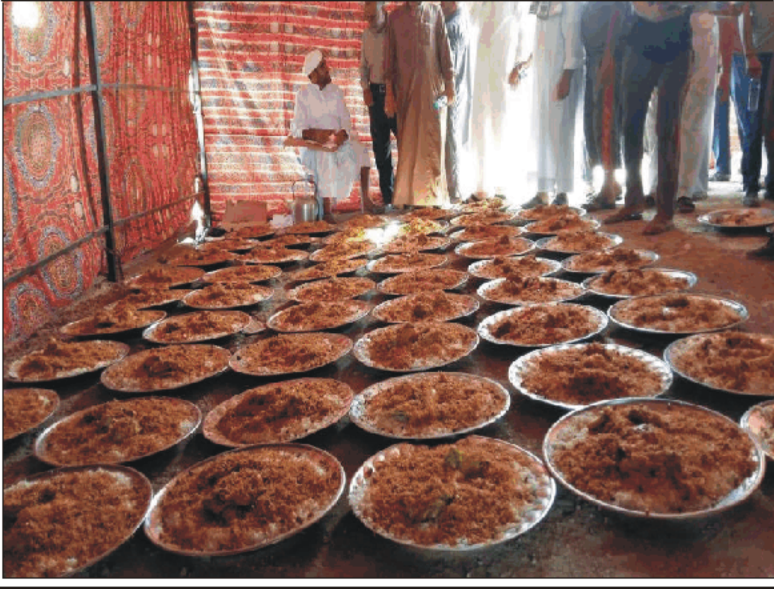
العراق اليوم، بغداد كشفت اعلام ديوان الوقف السني لـ "العراق اليوم"، بـ: "رئيس ديوان الوقف السني، عبد الطيف الهيم، وجه باستمرار ضيافة الديوان حجج بيت الله الحرام من محافظة نينوى، حيث تم استقبالهم في جامع أم القرى ببغداد، فضلاً عن فتح مخيمات في بربيز وعامرية الفلوجة"، وزاد المصدر في إيراد مزيد من التفاصيل: "بين رئيس اللجنة

المكفلة لرعاية الحجاج من محافظة نينوى، هذا التوجيه لرئيس ديوان الوقف السني، و قامت اللجنة المكفلة باستقبال حجج بيت الله الحرام في عامرية الفلوجة، حيث تم توفير اماكن مبيت واستراحة لهم مع توفير ثلاث وجبات طعام يومية، و عدد من المستلزمات الطبية، وفي جانب آخر، نقل لنا المصدر: "زار المفتش العام في ديوان الوقف السني، عثمان الجيوشي، كلية