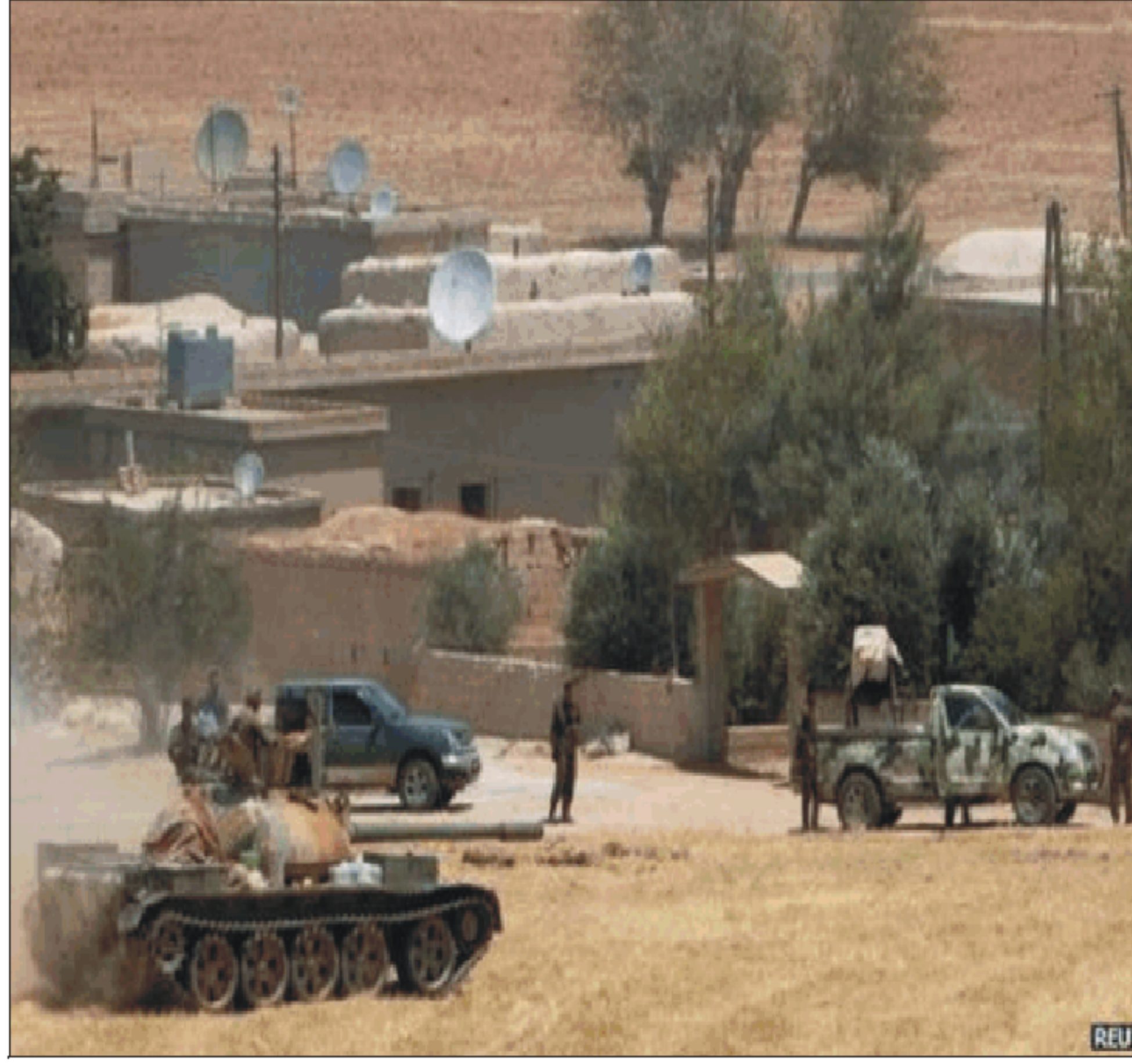
الاسلامية. كما أن السيطرة على تل أبيض تتيح للأكراد ربط الجيوب التي يسيطرون عليها مع بعضها البعض على الحدود مع تركيا. ويشارك أعضاء في الجيش السوري الحر في الهجمات على مسلحي تنظيم "الدولة الإسلامية".

لأن السيطرة على هذه المدينة تنتج التحكم في طريق الإمدادات المؤدي إلى مدينة الرقة التي يسيطر عليها مسلحو تنظيم "الدولة الإسلامية".