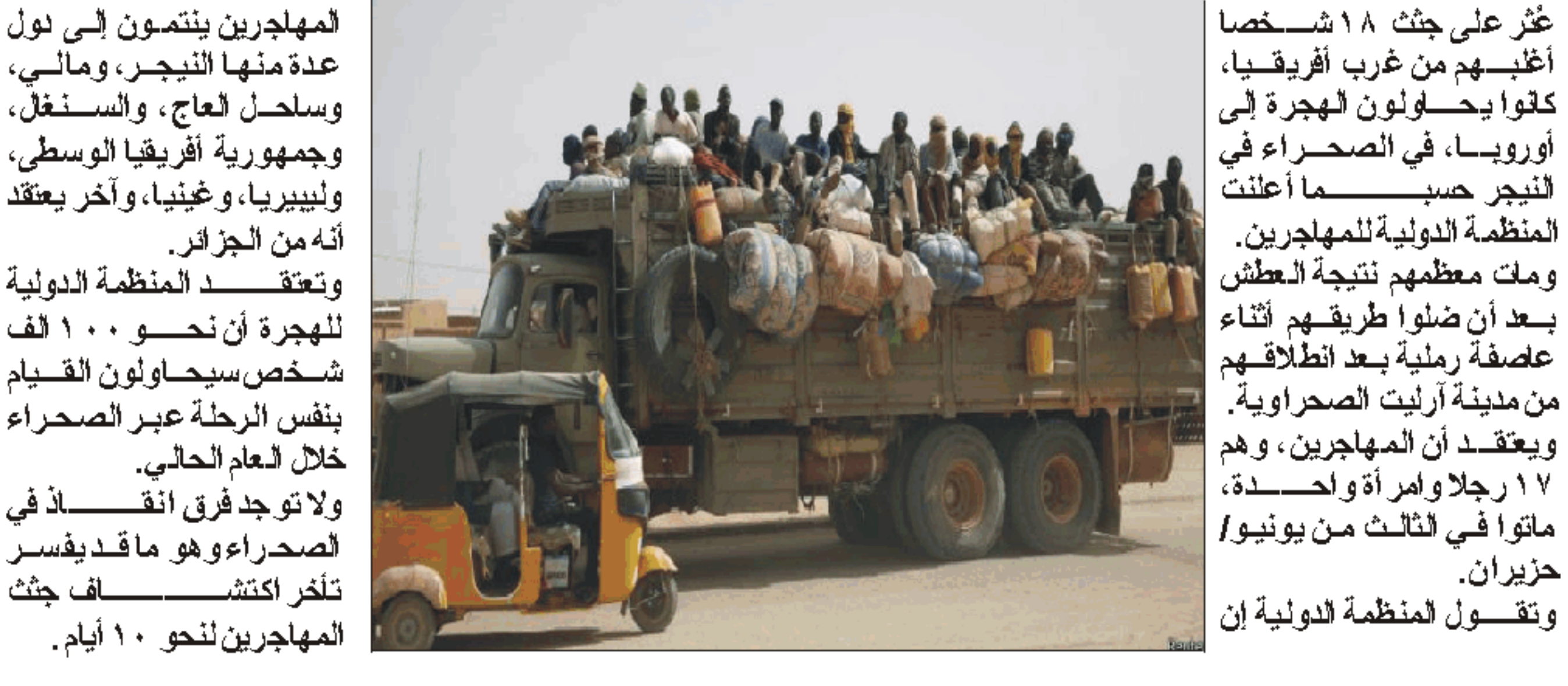
عثر على جثث 18 شخصا أغلبهم من غرب أفريقيا، كانوا يحاولون الهجرة إلى أوروبا، في الصحراء في النيجر حسبما أعلنت المنظمة الدولية للمهاجرين. ومات معظمهم نتيجة العطش بعد أن ضلوا طريقهم أثناء عاصفة رملية بعد انطلاقهم من مدينة أرليت الصحراوية. ويعتقد أن المهاجرين، وهم 17 رجلا وامرأة واحدة، ماتوا في الثالث من يونيو/حزيران. وتقول المنظمة الدولية إن

المهاجرين ينتمون إلى نول عدة منها النيجر، ومالي، وسنغال، وجمهورية أفريقيا الوسطى، وليبيريا، وغينيا، وآخر يعتقد أنه من الجزائر. وتعقد المنظمة الدولية للهجرة أن نحو 100 ألف شخص سيحاولون القيام بنفس الرحلة عبر الصحراء خلال العام الحالي.