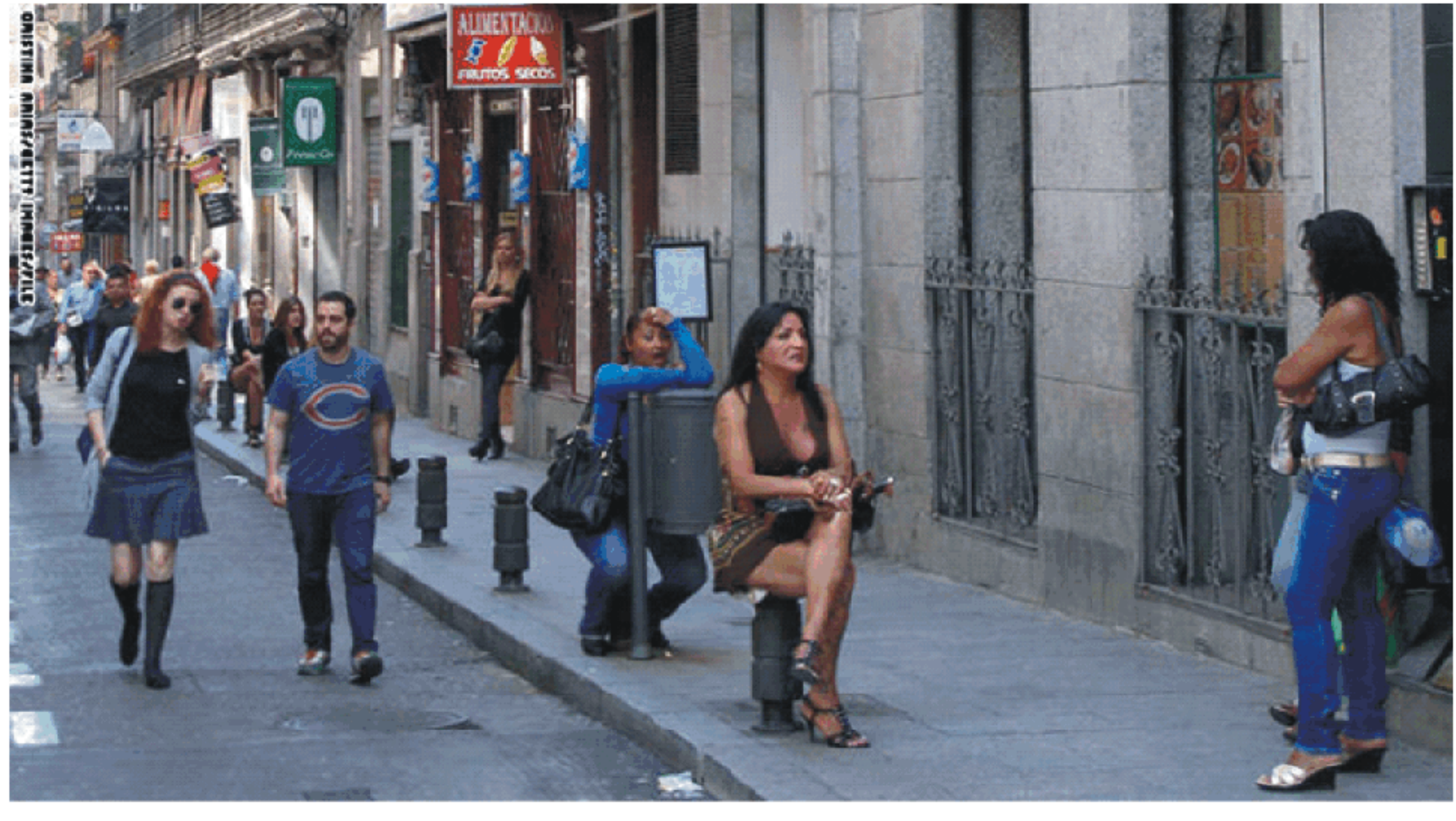
ذا غارديان أعضيتت جمعية للعاملين في الخدمات الجنسية ناشطات

تابعت الصحف العالمية مجموعة من الأخبار والموضوعات من أهمها محسوس إسرائيل من خرائط طيران الاتحاد الإماراتي، وجمعية إسبانية تطلق دورة بعنوان "مقدمة في الدعارة"، وازدياد الوعي في الأراضي الفلسطينية بجرانم الشرف. يبيعون أحرنونوت ذكرت تقارير إعلامية أن طيران الاتحاد الإماراتي مسح اسم إسرائيل من الخرائط الموجودة على متن طائرته. وقالت الصحيفة الإسرائيلية إن الولايات المتحدة تتفق مبلغ 45 ألف دولار سنوياً على وحدة المعايير والتدقيق الأمني في مطار أبو ظبي، المقرر الرئيسي لطيران الاتحاد، وبذلك اعتبرت أن محو اسم إسرائيل غير مقبول أبداً. ويرفض طيران الاتحاد استقبال مسافرين إسرائيليين على متنه، وذلك بسبب منع دخول حاملي جوازات السفر الإسرائيلية من دخول دولة الإمارات العربية المتحدة.